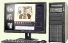
3D医用画像処理ワークステーション