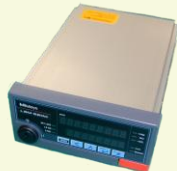
精密測定用ユニット