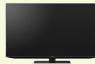
家庭用情報家電（テレビ・ブルーレイディスク）