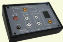
公営競技場モニター制御機器