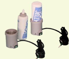
超音波用ゲルウォーマー