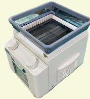
X線撮影装置ユニット