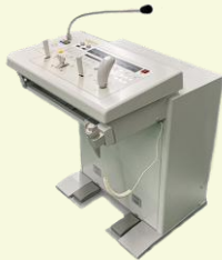
X線映像撮影操作デスク

クライアント企業様からの依頼により、設計・試作・部品調達・製造・検査・出荷までのプロセスを一括して受託いたします。品質保証国際規格ISO9001に基づいた品質保証体制により、各種制御機器、及びそれらの主要構成部品の開発・設計・部品調達製造まで一貫した生産体制で取り組んでいます。