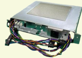
X線装置制御ユニット