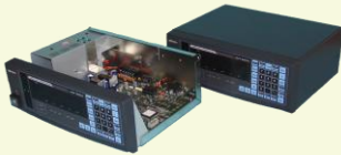
接触センサー用制御機器